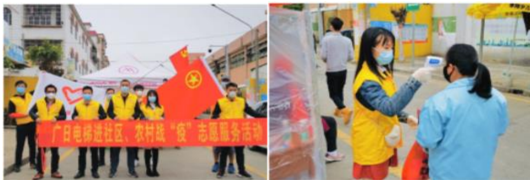
图 12 党员参加社区抗“疫”活动

公司在做好内部防疫防控工作的同时，各级党组织及广大党员积极投身周边社区及村居的疫情防控工作，共组成 6 个党组织疫情防控党员支援服务队，与周边社区签订共建协议，协助社区及村居开展疫情防控工作，与此同时，广大党员积极参加公司组织的自愿捐款活动，本次活动共收到捐款 83,968 元，进一步有力支持疫情防控工作顺利开展。