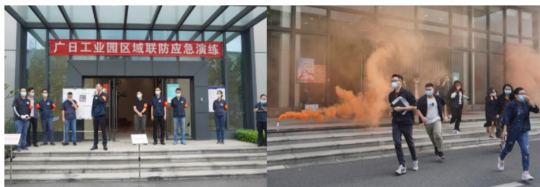
图 5 公司举行消防应急演练

四是持续健全企业志愿消防队伍，如广日工业园逐步完善消防安全区域联防机制，下属企业志愿消防队定期开展各种消防训练活动和火灾应急救援专项演练，做到能随时拉得出，用得上。