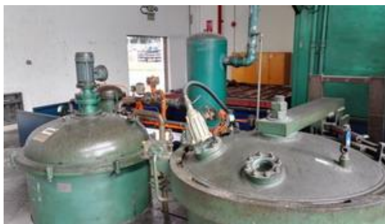
图 6 变压器绝缘漆真空压力浸漆设备

广日电气研发实施了变压器产品改良生产工艺，降低了耗电量并将原有的非环保绝缘漆更换为环保绝缘漆，从源头降低绝缘漆的甲苯有害挥发成分，达到节能环保的效果，单位生产时间减少 3 小时。