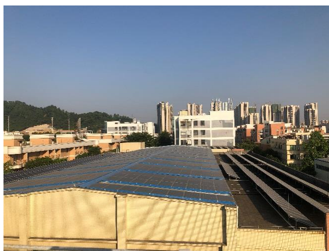
图 8 厂房屋顶并网型太阳能光伏发电工程一期（550KW）

公司智能装备制造产业积极响应国家号召，松兴电气经申报获批准在现有厂房屋顶建设总规模 600KW 的并网型太阳能光伏发电工程。2020 年光伏发电工程已全面完成并网发电，实现太阳能、建筑的综合利用，成功节省电费 28 万元。不仅让企业达到节能减排的效果，也尽到了改善周边环境的社会责任。