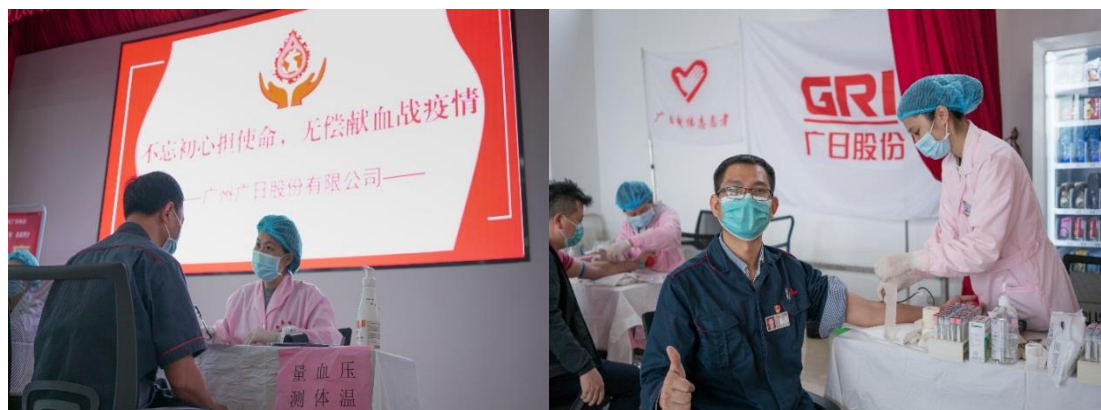
图 13 广大职工积极参与献血活动

87,020 毫升，在疫情防控的大战与大考中，公司以实际行动践行国企的责任与担当，为坚决打赢疫情防控阻击战贡献力量。