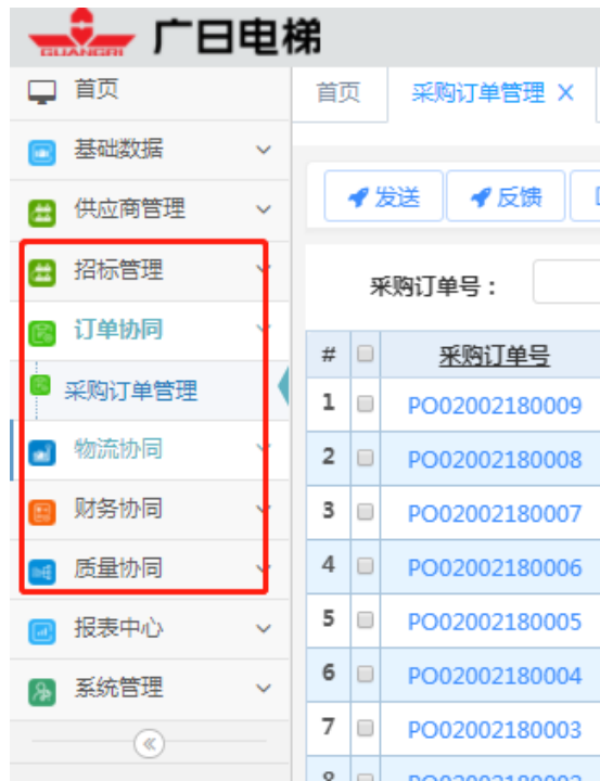
图 2 SRM 系统

广日电梯通过 SRM 信息化管理平台把招投标工作转变成线上，简化了工作准备环节，最大限度保证了业务公平性、效率性，并将相关订单处理也转至 SRM 系统，实现了供应商处理订单效率提升，降低劳动强度，从根本上实现公司快速响应的核心价值。此外，SRM 系统也可以对产品质量问题进行有效监控，及时传达与记录产品质量问题，加快了质量问题的处理速度，促进整个供应链质量水平优化与提升。