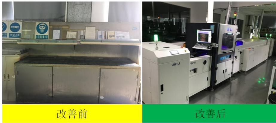
图 7 自动化喷涂线实施效果对比图

公司现代服务业推进业务信息化建设推广无纸化办公，促进节能减排低碳经营。在日常办公方面，从推广移动办公平台入手，推动智慧物流平台、采购供应链平台等信息系统研发，实现公司、客户及供应商信息、数据共享。在生产方面，公司通过严格处理粉尘污染、定期检测污水排放、控制削减车辆废气排放、使用防爆电箱、风扇和灯具等方式多措并举做好“三废”处理。2020年，公司委托广东诚浩环境监测有限公司对公司环保工作进行监测，公司废气、废水和噪声排放均达国家安全标准。