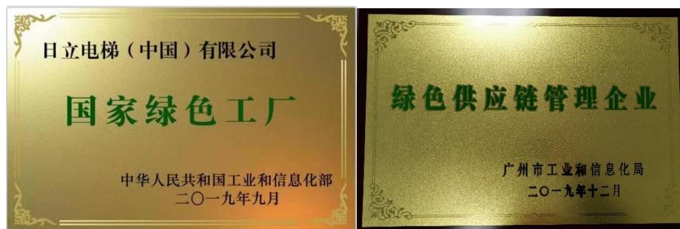
图9 日立电梯荣誉证书

成效的事业所评定为“精选环保工厂&办公室”。目前，日立电梯五个制造基地中5个整梯工厂及2个核心部件工厂均被评为“精选环保工厂&办公室”。日立电机（广州）有限公司和日立电梯（广州）自动扶梯先后入选“国家绿色工厂”，并分别获得了“广州市绿色工厂”及“绿色供应链管理企业”称号。