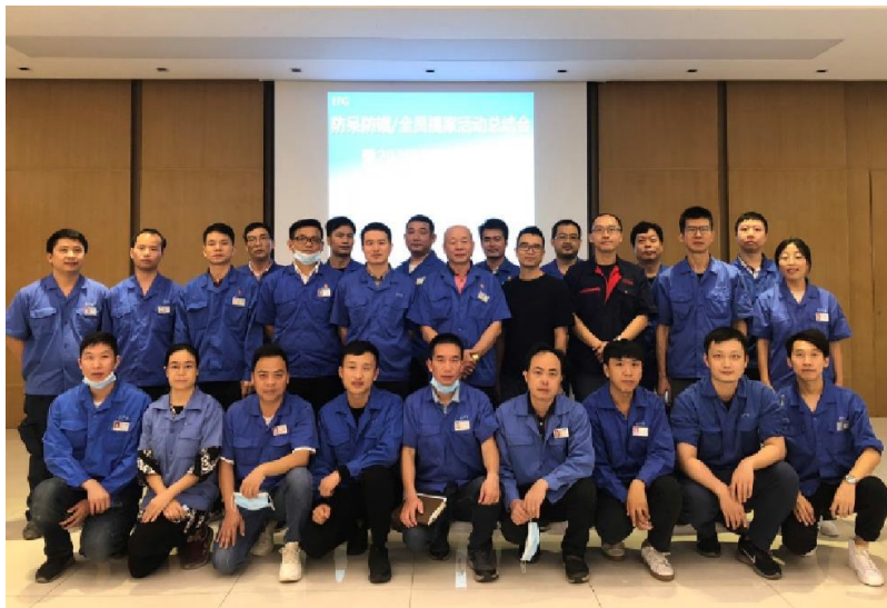
图 3 防呆防错总结暨拾落穗发布会

广日电气推动完成 GB/T 29490 与 IATF16949 换证审核，以及 ISO9001、ISO14001、ISO45001 的年度监督审核工作并顺利通过了莱茵 TUV 的四标体系与中知的知识产权体系审核获得认证。2020 年，公司积极实施各部门的 QCC 质量小组活动，参加广东省、广州市相关质量管理小组活动发表，共荣获 7 项奖项；在主要客户日立电梯的供应商质量评分中获得优异成绩。