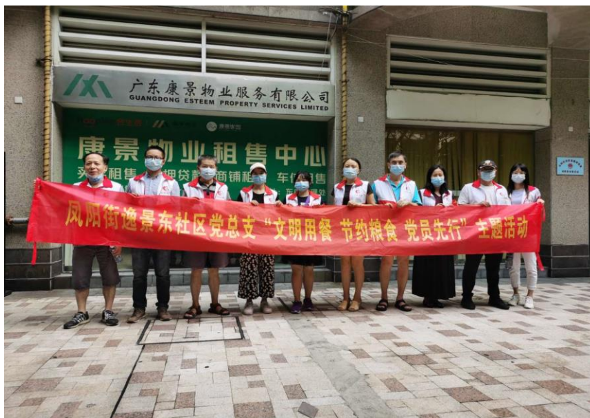
图 14 在职党员进社区活动

在创建全国文明城市攻坚之际，公司进行“在职党员回社区参加创文活动开展服务”的活动，公司上下参加创文活动党员人次数达 1,026 人，各个党员充分当好文明创建宣传者、志愿者、示范者，闻令而动，以身作则，协助基层社区开展文明创建宣传、卫生环境清理、共享单车清理等多项工作，助力创建文明城市，共享美丽家园。